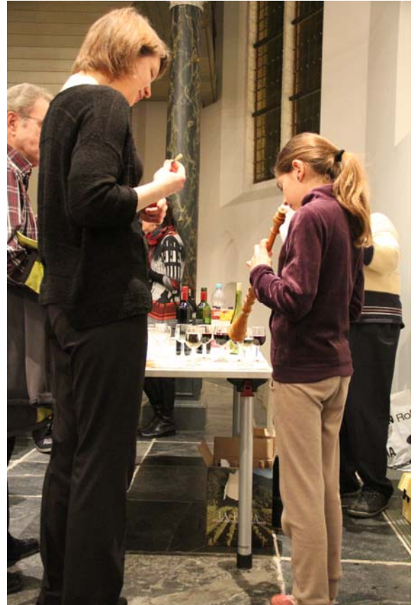
En zo werkt de barokhobo